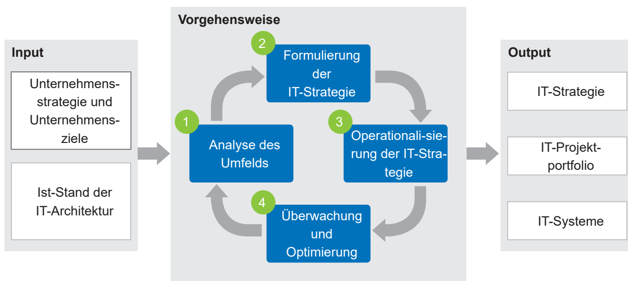
Bild 1: Vorgehen zur Entwicklung einer IT-Strategie (HOFFMANN 2018, S. 36)

Die Formulierung der IT-Strategie folgt einem Top-down-Approach, der ein gesamtheitliches Bild aus IT-Vision, IT-Mission und IT-Zielen ergibt (s. TIEMEYER 2017, S. 30). Die IT-Vision wird für die kommenden fünf Jahre festgelegt und dient als Orientierung, motiviert Mitarbeiter und setzt Kreativität frei. Anschließend ergänzt die IT-Mission die IT-Vision um übergeordnete Aufgaben sowie die IT-Kultur. Für die IT-Strategie lassen sich daraus konkrete Ziele ableiten. Die Ziele werden idealerweise in Form von Zielbildern dargestellt, welche die IT-