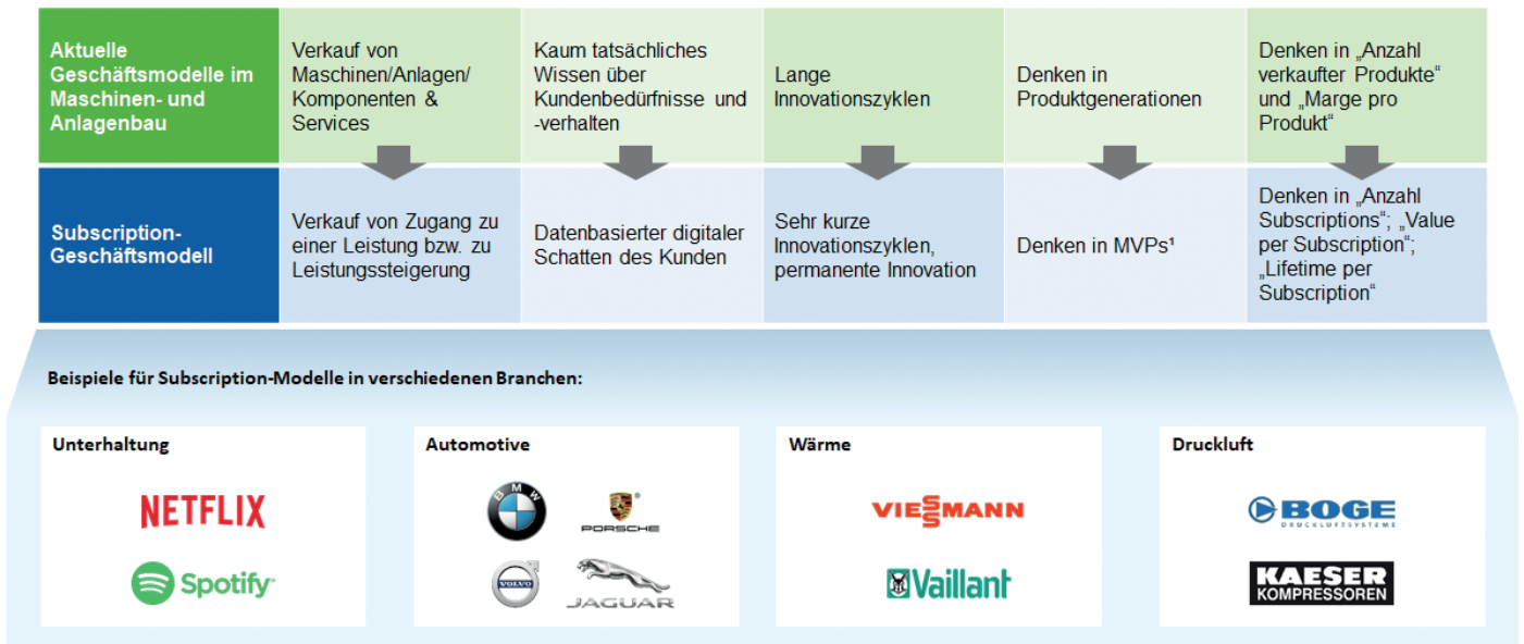
Bild 2: Eigenschaften und Verbreitung von Subscription-Geschäftsmodellen

hohen Betriebs- bzw. Energiekosten von Kompressoren von hoher Relevanz.